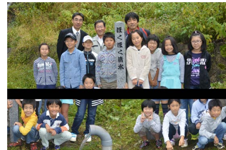
【H25 わき水調査隊】